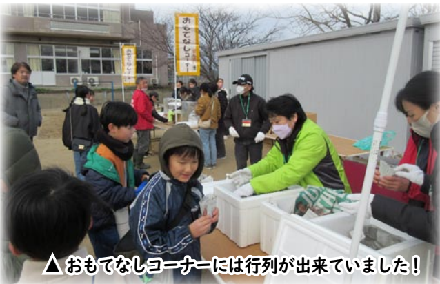
▲おもてなしコーナーには行列ができていました！