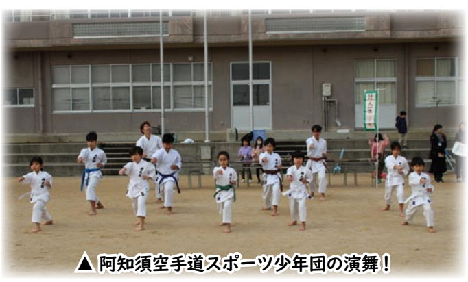
▲阿知須空手道スポーツ少年団の演舞！