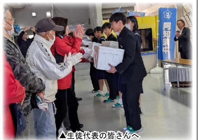
▲生徒代表の皆さんへ

この焼き芋は、阿知須地域づくり協議会が管理されている市民農園「きらら家菜農園」で11月に収穫したサツマイモを使って、当日の下校時間に合わせて中学校の玄関前で1つずつ丁寧に焼きあげられたものです。